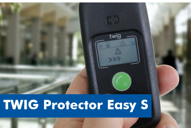
TWIG Protector Easy S